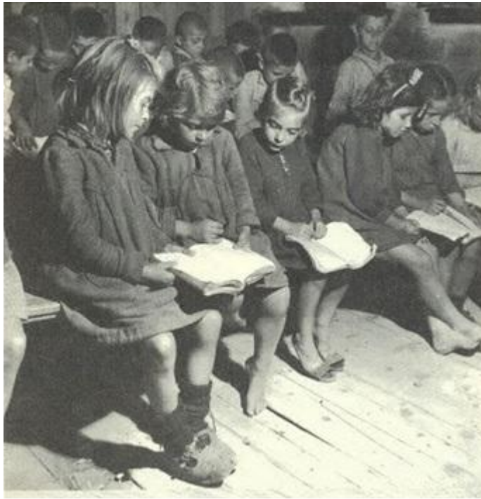
Κάτι ανάλογο και στα κοριτσάκια...και βέβαια πού βιβλία... ένα βιβλίο για δύο άτομα...(Δημοτικό Σχολείο Καναλιών Βόλου-1949-)