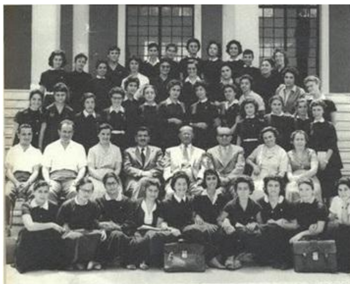
5ο Γυμνάσιο Θηλέων Θεσσαλονίκης. Η ποδιά απαραίτητη στις μαθήτριες, το ίδιο και ο γιακάς...