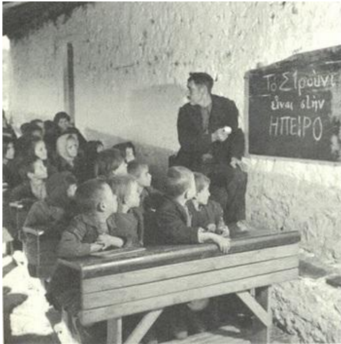
Εδώ δεν υπάρχει ούτε καν αίθουσα...το μάθημα έξω...ο πίνακας φαίνεται μόνο σε λίγους και αυτό με πολύ δυσκολία...( Δημοτικό Σχολείο Ηπείρου 1950 )