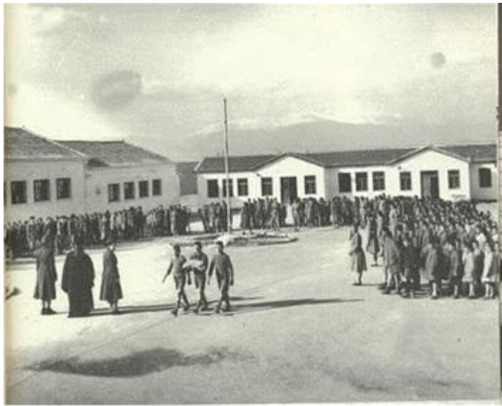
Υποστολή σημαίας σε παιδόπολη τη δεκαετία του 1950