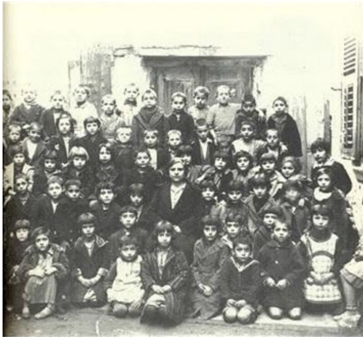
Δημοτικό σχολείο στο Βαρδάρη Θεσσαλονίκης(1930)...καμιά 60αριά παιδιά με μόνο μία δασκάλα!!!