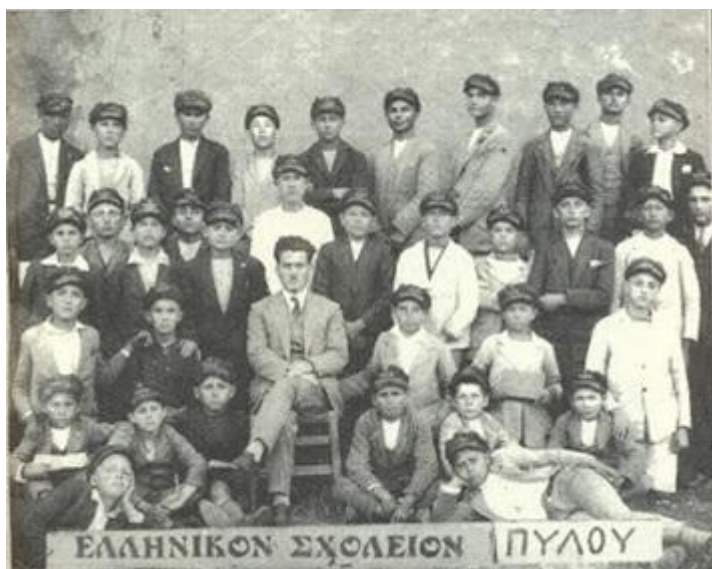
Ελληνικό Σχολείο Αρρένων Πύλου (1930) ...όταν η τραγιάσκα επιβάλλονταν για τα αγόρια...